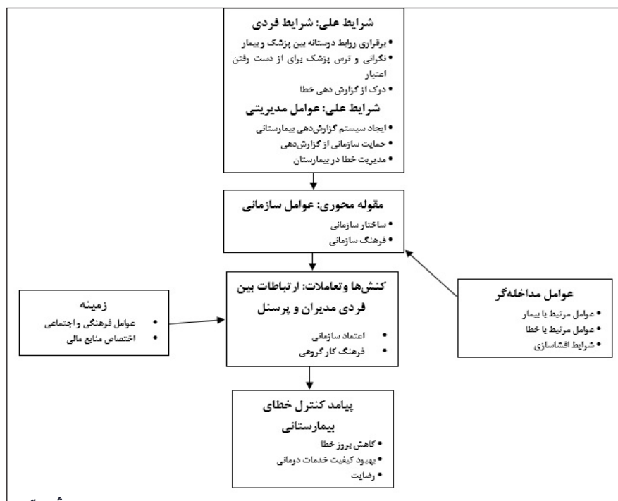
تصویر ۱- مدل مفهومی تحقیق.

تجزیه و تحلیل اطلاعات در این گام بر مبنای روش کدگذاری نظری انجام شد. کدگذاری نظری روشی است برای تحلیل داده‌هایی که به‌منظور تدوین یک نظریه به روش نظریه‌پردازی داده-بنیاد گردآوری شده‌اند. در این روش مفاهیم درون مصاحبه‌ها و اسناد و مدارک بر اساس ارتباط با موضوعات مشابه طبقه‌بندی می‌شوند که به این کار مقوله‌پردازی گفته می‌شود. در تحقیق حاضر، مصاحبه‌های صورت گرفته مورد بررسی دقیق و هنگام مطالعه آن‌ها، پرسش اصلی که در حقیقت تلاش دارد به تبیین مدل کنترل خطای پزشکی در بیمارستان‌های وابسته به سازمان تأمین اجتماعی استان خوزستان بپردازد، مطرح شد. کدگذاری و مقوله‌پردازی داده در راستای شناسایی معیارها و زیرمعیارهای مدل کنترل خطای پزشکی در بیمارستان‌های وابسته به سازمان تأمین اجتماعی استان خوزستان صورت گرفت. با توجه به روش‌شناسی «تحلیل محتوای کیفی» تعداد