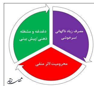
تصویر ۱- مراحل چرخه اعتیاد

اعتیاد استفاده مداوم از یک ماده با وجود مشکلات قابل توجه مربوط به آن است. اعتیاد دارای علائم شناختی، رفتاری و فیزیولوژیکی ویژه‌ای است که مهم‌ترین آن‌ها عبارتند: از دست دادن کنترل در محدود کردن مصرف، وجود حالت عاطفی منفی (ملالت، اضطراب، تحریک‌پذیری) در زمان فقدان ماده و اجبار به جست‌وجو برای مصرف آن است (۱). درک بخشی از مکانیسم‌های ایجاد اعتیاد به مصرف موادی خاص نظیر اوبیوئیدها، کوکائین و الکل از مطالعه مدل‌های حیوانی به دست آمده است. با وجود این که مدل‌های حیوانی اعتیاد که تاکنون ایجاد شده‌اند، هیچ یک به طور کامل با شرایط اعتیاد انسانی انطباق ندارند، اما وجود مدل‌های متفاوت، امکان بررسی مولفه‌های خاصی از فرایند اعتیاد را به پژوهشگران می‌دهند. در بعضی از این مدل‌ها، ابعاد روانشناختی اعتیاد نظیر تقویت مثبت و منفی ارزیابی می‌شود. در مدلی دیگر، مراحل متفاوتی از چرخه اعتیاد و در دیگر مدل‌ها علائم اعتیاد از دیدگاه روانپزشکی ارزیابی می‌شوند (۲). اعتیاد به مواد به صورت چرخه سه مرحله‌ای: ۱- مصرف زیاد ناگهانی/ سرخوشی ۱ و ۲. محرومیت/ اثر منفی ۲ دغدغه و مشغله ذهنی/ پیش‌بینی (ولع مصرف) ۳ توصیف می‌شود (تصویر ۱) (۳).