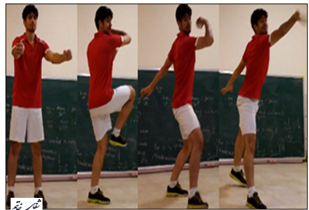
تصویر ۱- نحوه پرتاب توپ به سمت هدف که در فاصله ۵ متری فرد و روی دیوار قرار گرفته است.

به واسطه خم شدن زانو و لگن، خط میانی بدن را قطع می‌کند و همراه با آن دست راست با نزدیک شدن افقی شانه و خم کردن آرنج، هدف را نشانه می‌گیرد. در این حالت، فرد در وضعیت پرتاب بک‌هند قرار می‌گیرد. سپس بازو به سمت هدف کشیده شده و آرنج کاملاً باز می‌شود و پس از آن با باز شدن انگشتان دست، توپ به سمت هدف رها می‌شود. همراه با حرکت بازو، یک گام بلند به سمت جلو به وسیله پای همسو (که قبلاً در وضعیت خم لگن و زانو و به صورت معلق در فضا در آمده بود) انجام می‌شود. پرتاب کننده از اصول حلقه جنبشی باز بهره می‌برد. به این معنی که رسیدن به اوج سرعت باز شدن ساعد، پس از رسیدن به اوج سرعت بازو اتفاق می‌افتد، یعنی هنگامی که تنه به سمت جلو چرخیده است. همچنین قسمت پایینی تنه قبل از قسمت بالایی تنه به سمت جلو می‌چرخد. این تمایزات بین حرکات بخش‌های مختلف و به تأخیر انداختن حرکت بازو منجر به، به حداکثر رساندن سرعت پرتاب توپ می‌شود (۲۴).