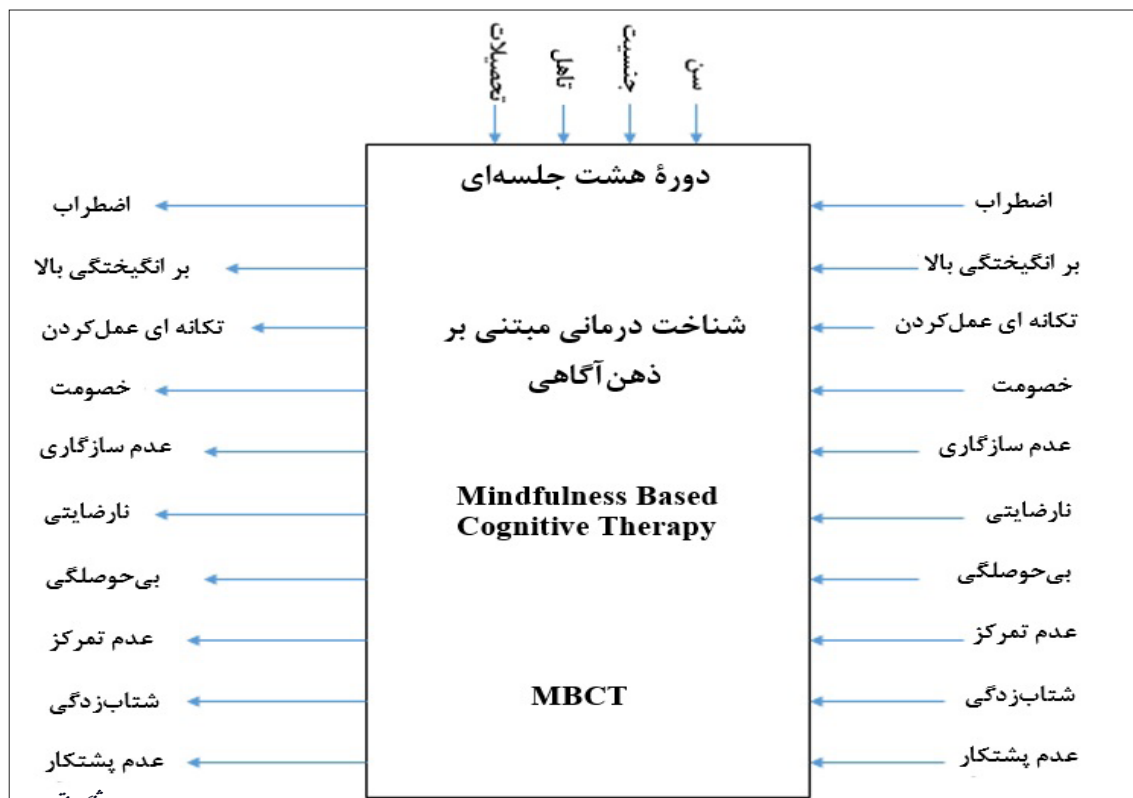
تصویر ۱- ورودی و خروجی های مدل ها

در علم یادگیری ماشین ۱۶ ، به موضوع طراحی ماشین هایی پرداخته می شود که با استفاده از مثال های داده شده به آن ها و تجربیات خودشان، بیاموزند. در این علم تلاش می شود تا با بهره گیری از الگوریتم ها، یک ماشین به شکلی طراحی شود که بدون آن که صراحتاً برنامه ریزی و تک تک اقدامات به آن دیکته شود بتواند بیاموزد و عمل کند. در یادگیری ماشین، به جای برنامه نویسی همه چیز، داده ها به یک الگوریتم عمومی داده می شوند و این الگوریتم است که براساس داده هایی که به آن داده شده منطق خود را می سازد. یادگیری ماشین روش های گوناگونی دارد که از آن جمله می توان به یادگیری نظارت شده، نظارت نشده و یادگیری تقویتی اشاره کرد. الگوریتم های مورد استفاده