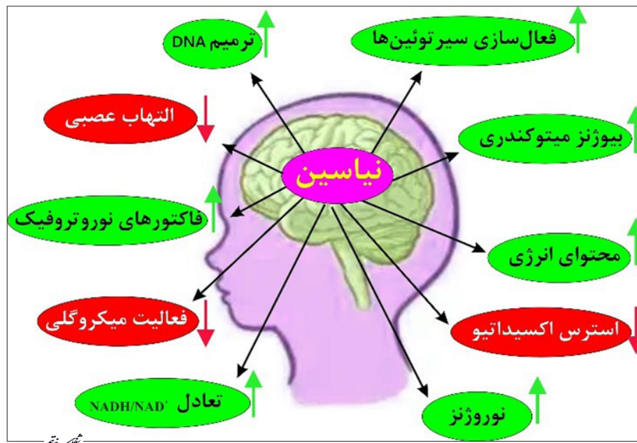
تصویر ۲- عملکردهای مهم ویتامین B۳ (نیاسین) در سیستم اعصاب مرکزی

با توجه به ویژگی‌های آنتی‌اکسیدانی، ضدالتهابی، و تنظیم‌کننده متابولیسم انرژی، نیاسین به‌عنوان یک عامل محافظت عصبی در بسیاری از مطالعات پیشنهاد شده است. افزایش سطح NAD^+ منجر به بهبود کارایی