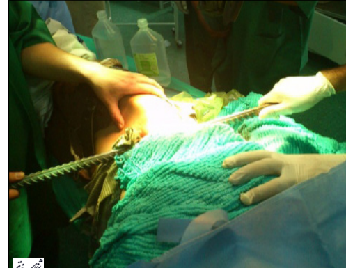
تصویر ۴- سوراخ خلفی محل خروج میله از شکم.