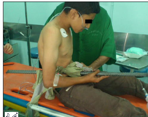
تصویر ۲- وضعیت خوابیده به پشت جهت باز کردن شکم و خروج میله.