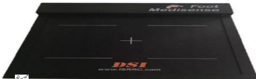
تصویر ۱- دستگاه فوت مدیسنس