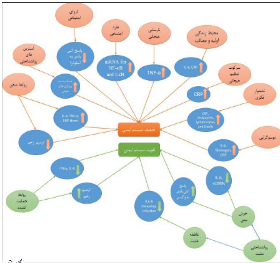
تصویر ۲- تأثیر فرایندهای درون فردی و بین فردی بر سیستم ایمنی. فرایندهای درون فردی و بین فردی عمدتاً با تأثیر بر مکانیسم‌های التهابی می‌توانند منجر به تعدیل بهبود و یا تضعیف سیستم ایمنی شوند.

نشخوار فکری به صورت افکار یا تصاویر آگاهانه، غیر