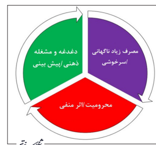
تصویر ۱- مراحل چرخه اعتیاد

اعتیاد استفاده مداوم از یک ماده با وجود مشکلات قابل توجه مربوط به آن است. اعتیاد دارای علائم شناختی، رفتاری و فیزیولوژیکی ویژه‌ای است که مهم‌ترین آن‌ها عبارتند: از دست دادن کنترل در محدود کردن مصرف، وجود حالت عاطفی منفی (ملالت، اضطراب، تحریک‌پذیری) در زمان فقدان ماده و اجبار به جست‌وجو برای مصرف آن است (۱). درک بخشی از مکانیسم‌های ایجاد اعتیاد به مصرف موادی خاص نظیر اوبیوئیدها، کوکائین و الکل از مطالعه مدل‌های حیوانی به دست آمده است. با وجود این که مدل‌های حیوانی اعتیاد که تاکنون ایجاد شده‌اند، هیچ یک به طور کامل با شرایط اعتیاد انسانی انطباق ندارند، اما وجود مدل‌های متفاوت، امکان بررسی مولفه‌های خاصی از فرایند اعتیاد را به پژوهشگران می‌دهند. در بعضی از این مدل‌ها، ابعاد روانشناختی اعتیاد نظیر تقویت مثبت و منفی ارزیابی می‌شود. در مدلی دیگر، مراحل متفاوتی از چرخه اعتیاد و در دیگر مدل‌ها علائم اعتیاد از دیدگاه روانپزشکی ارزیابی می‌شوند (۲). اعتیاد به مواد به صورت چرخه سه مرحله‌ای: ۱- مصرف زیاد ناگهانی/ سرخوشی ۱ و ۲. محرومیت/ اثر منفی ۲ و دغدغه و مشغله ذهنی/ پیش‌بینی (ولع مصرف) ۳ توصیف می‌شود (تصویر ۱) (۳).